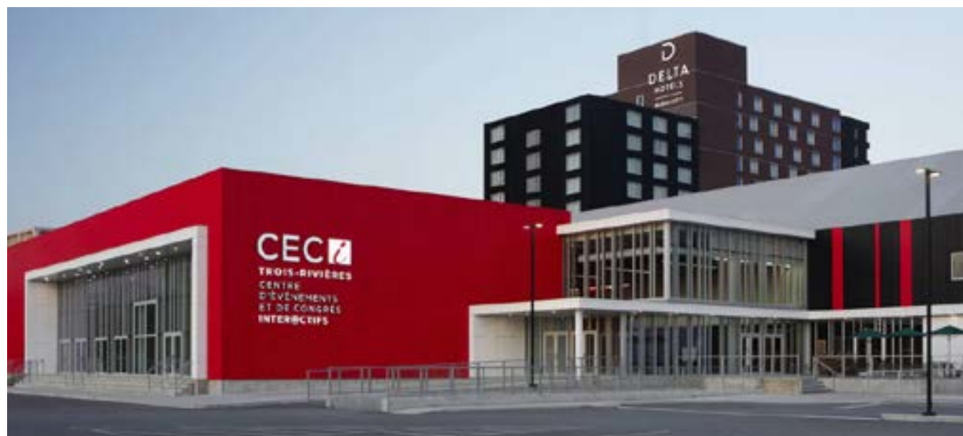
Centre d'événements et des congrès de Trois-Rivières

Pour l'occasion, nous attendons un auditoire composé d'enseignantes et enseignants, de conseillères et conseillers pédagogiques, de chercheuses et chercheurs du préscolaire à l'université, venant de partout au Québec.